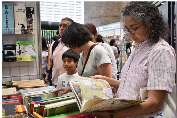
Libros de todos los géneros se ofertaron durante el Gran Remate de Libros.