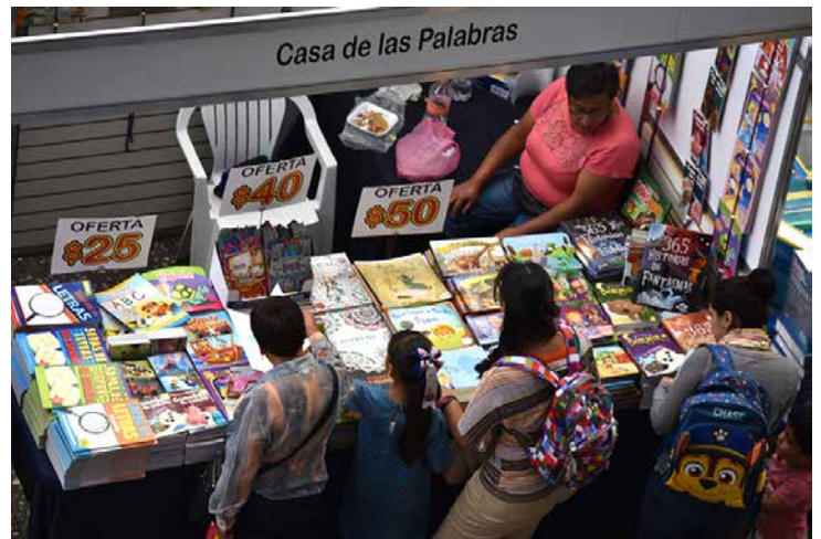
Ofertas de hasta un 80 por ciento eran fáciles de encontrar.

sobre todo el jueves. Me parece que esta intención de rescatar libros y ponerlos a precios accesibles es buena, siempre y cuando las editoriales respeten esta política de bajos precios".