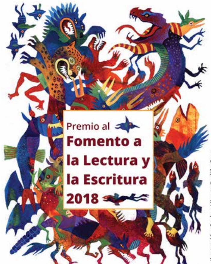
Ilustración: Carlos Alberto Badillo Cruz

Entre los premios están $50,000 y una colección de libros. El plazo para inscribirse termina el 3 de agosto de 2018. Puede consultar las bases del certamen aquí.