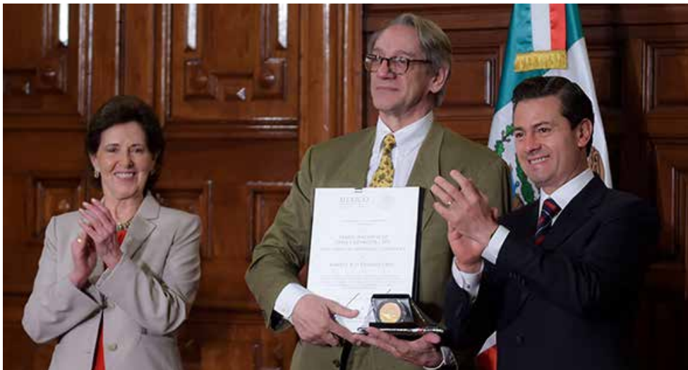
Alberto Ruy Sánchez recibiendo de manos de Enrique Peña Nieto el Premio Nacional de Artes y Literatura 2017.