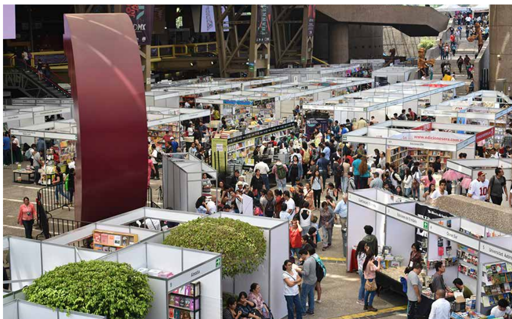
121 mil 200 personas acudieron a lo largo de los ocho días del remate.

Además, se realizaron charlas, homenajes, maratones de lectura e intervenciones escénicas en torno a la obra de los escritores Jorge Ibargüengoitia, Carlos Fuentes, Amparo Dávila, Carlos Monsiváis, Raúl